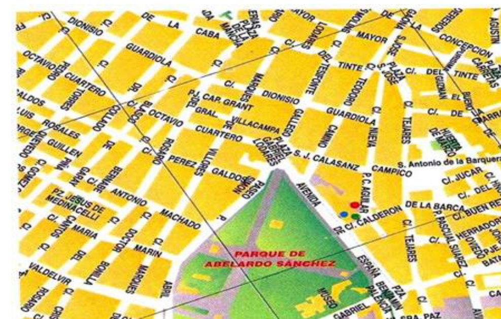
Avenida de España 7 Calle Calderón de la Barca s/n Calle Periodista del Campo Aguilar s/n

Otra entrada se localiza en la calle Periodista del Campo Aguilar s/n, que corresponde al edificio anexo de la Subdelegación del Gobierno (Dependencias de Área de Agricultura, Industria y Energía, Sanidad, Trabajo e Inmigración; Gerencia de Justicia; Muface).